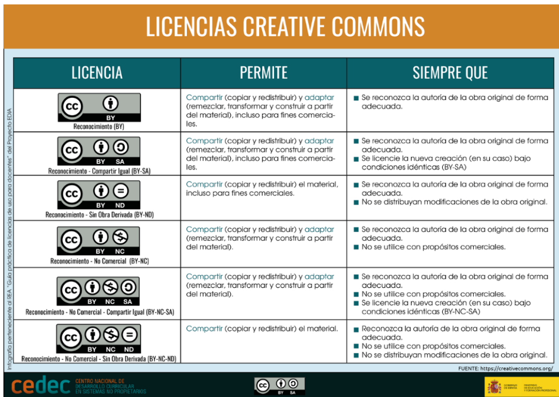
Figura 4. “Licencias Creative Commons” de CEDEC. Recursos | Cedec (intef.es) Licencia CC BY-SA 4.0.